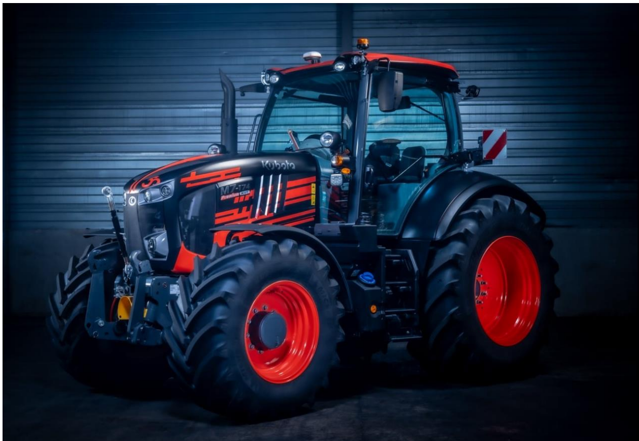
Image : Kubota M7-174 KVT Anniversary Edition La série M7004 s'intègre parfaitement aux packs existants de Kubota, y compris une garantie prolongée jusqu'à 5 ans/5 000 heures, ainsi que Kubota Connect – la toute dernière technologie télématique du tracteur qui permet aux utilisateurs d'accéder à distance à l'emplacement du tracteur et aux principales fonctions d'exploitation, afin d'améliorer la gestion des actifs.

Le lancement de la nouvelle série M7004 coïncide également avec la célébration par Kubota de son 50e anniversaire en Europe. Pour marquer l'occasion, 50 tracteurs M7004, édition anniversaire, seront produits, chacun arborant un enveloppement orange et noir saisissant.