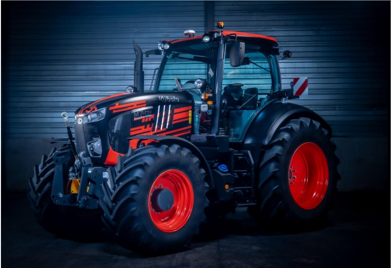
Bild: Kubota M7-174 KVT Jubiläumsausgabe

Die Markteinführung der neuen M7004-Serie fällt zudem mit dem 50-jährigen Jubiläum von Kubota in Europa zusammen. Anlässlich des Jubiläums werden 50 Sondermodelle des Typs M7004 im schwarz-orangen Design produziert.