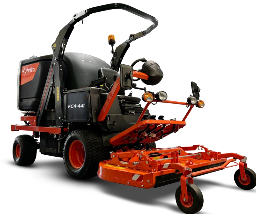
Bild: FC4-441 Prototyp

Kubota freut sich, die neueste Ergänzung seiner Produktreihe von professionellen Frontmähern bekannt zu geben: das neue 44 PS starke Modell FC4-441.