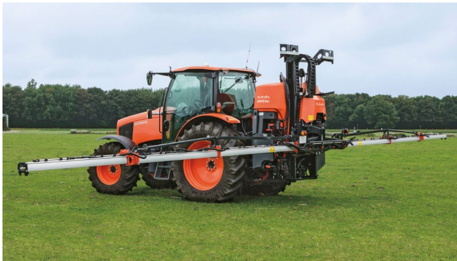
Afbeelding: De XMS1 gedragen veldspuit met iXClean Plus-reinigingssysteem.

Met de introductie van de iXspray-software en -hardware op de op de XMS1 gedragen veldspuit biedt Kubota een compleet assortiment ISOBUS-compatibele spuitmachines met verhoogde gebruiksvriendelijkheid voor het kleinere landbouwsegment. De nieuwe optionele iXClean Plus-reinigingsfunctionaliteit zorgt ervoor dat het spuitwerk op een milieuvriendelijke en veilige manier voor de chauffeur wordt uitgevoerd, maar ook met de hoogst mogelijke nauwkeurigheid en efficiëntie.