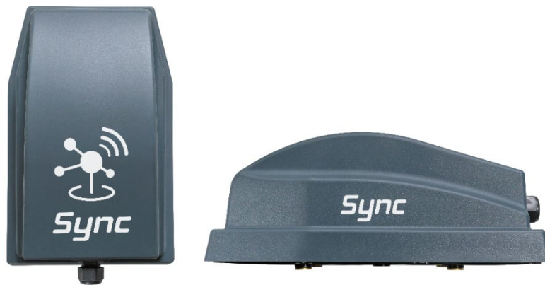
Immagine: Kubota Sync - Il nuovo gateway per l'implementazione

Per celebrare il 50° anniversario di Kubota, siamo entusiasti di annunciare un piano per un progresso significativo nel nostro ecosistema di prodotti: Kubota Sync. Questo nuovo gateway è destinato a consentire uno scambio di dati continuo in agricoltura, rafforzando il costante impegno di Kubota per la produttività, la qualità, la crescita e la sostenibilità. Mentre celebriamo questo anno fondamentale, Kubota Sync rappresenta uno sviluppo chiave nel plasmare il futuro dell'agricoltura connessa e moderna.