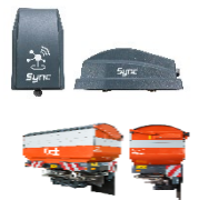
Immagine Kubota ISOBUS Spreader collegato con Kubota Sync

Immagine Kubota Sync - Il nuovo gateway per l'implementazione