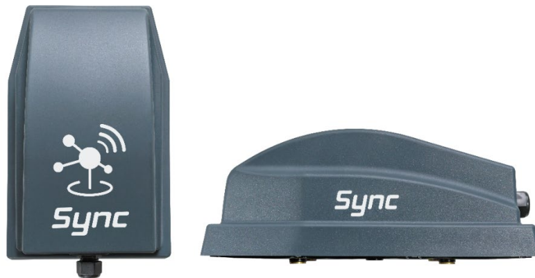
Image : Kubota Sync - La nouvelle passerelle de mise en œuvre

À l'occasion du 50e anniversaire de Kubota, nous sommes heureux d'annoncer un plan visant à faire progresser de manière significative notre écosystème de produits : Kubota Sync. Cette nouvelle passerelle est destinée à permettre un échange de données transparent dans l'agriculture, renforçant ainsi l'engagement continu de Kubota en faveur de la productivité, de la qualité, de la croissance et de la durabilité. Alors que nous célébrons cette année charnière, Kubota Sync représente un développement clé pour façonner l'avenir de l'agriculture connectée et moderne.