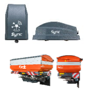
Imagen Esparcidora Kubota ISOBUS conectada con Kubota Sync

Imagen Kubota Sync - La nueva puerta de enlace de implementos