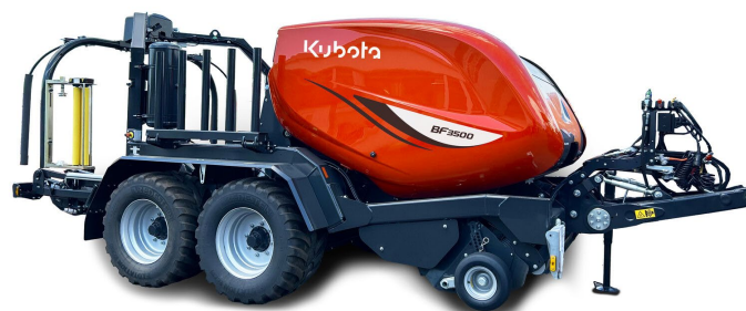
Afbeelding: Kubota BF3500 FlexiWrap

De Kubota BF3500 serie is veelzijdiger geworden met de introductie van film-op-film toepassing, waardoor gebruikers kunnen profiteren van de verbeteringen in de silagekwaliteit.