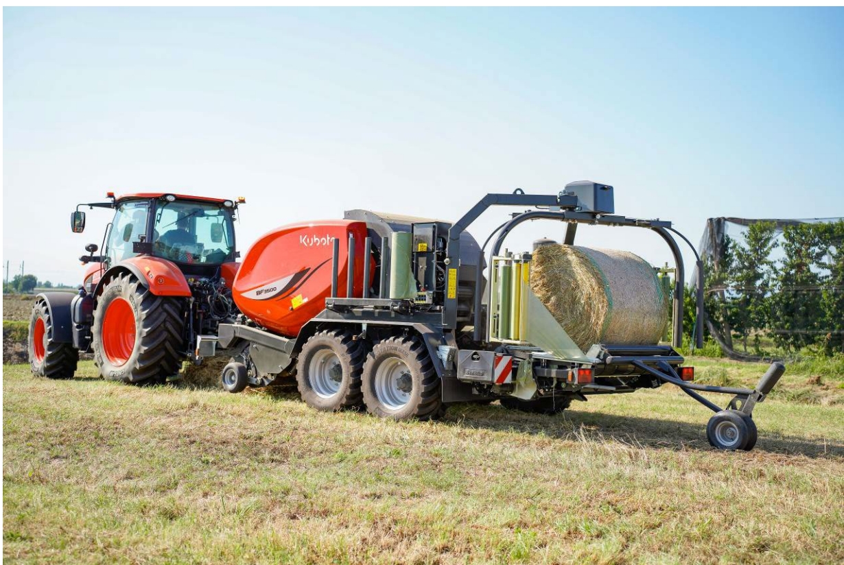
Afbeelding: Kubota BF3500 FlexiWrap ontworpen voor efficiënt persen en wikkelen.

Nieuwe BF3500 FlexiWrap Kubota perswikkelcombinatie