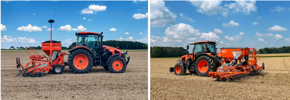
Afbeelding 2/3: Kubota starre SD1401 en opklapbare SD1601F

De starre modellen SD1001 zijn uitgerust met een trechterinhoud van 750l (1000l met verlenging) en de mechanische doseerinrichting die elke gewenste zaadhoeveelheid van 2kg - 380kg per hectare mogelijk maakt.