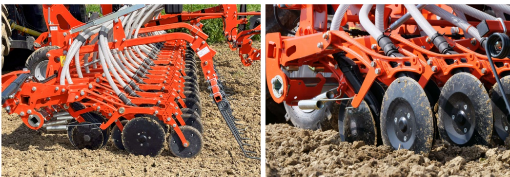
Afbeelding 4/5: Kubota opgespannen CX-II kouter met/zonder aandrukwielen

De kouters worden op de kouterbalk geklemd: "Met de flexibele koutersteunen kan de boer de afstand tussen de rijen aanpassen aan de individuele landbouwsystemen. Vanuit de fabriek leveren we een vooraf ingestelde rijafstand van 12,5 cm of 25,0 cm. De kouterdruk kan mechanisch worden ingesteld van 5 tot 50 kg of hydraulisch bij het opklapbare model. Dit zorgt voor een optimale penetratie aangepast aan de individuele omstandigheden", legt Sebastian Koers, Product Manager Seeding Technology, uit.