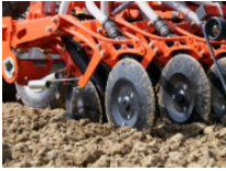
Afbeelding 5: Kubota opgespannen CX-II kouter zonder perswiel