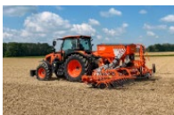
Afbeelding 2: Kubota SD1601F