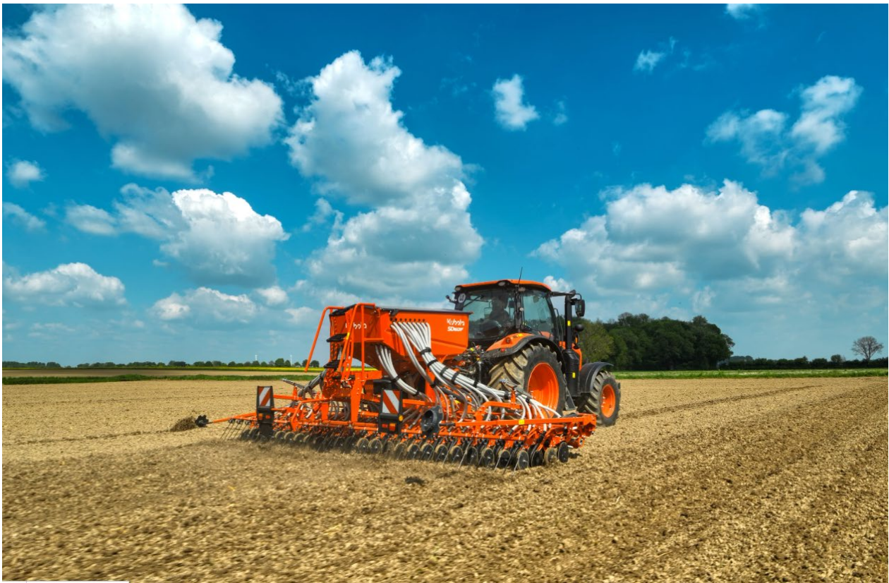
Afbeelding 1: Kubota SD1601F, 6,00 m werkbreedte, e-comodel, volledig ISOBUS-compatibel

Kubota introduceert een nieuwe generatie solo zaaimachines. Het starre model SD1001 is verkrijgbaar in 3,00 m en 4,00 m en het opklapbare model SD1001F in 5,00 m en 6,00 m werkbreedte.