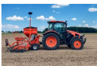
Afbeelding 3: SD1401