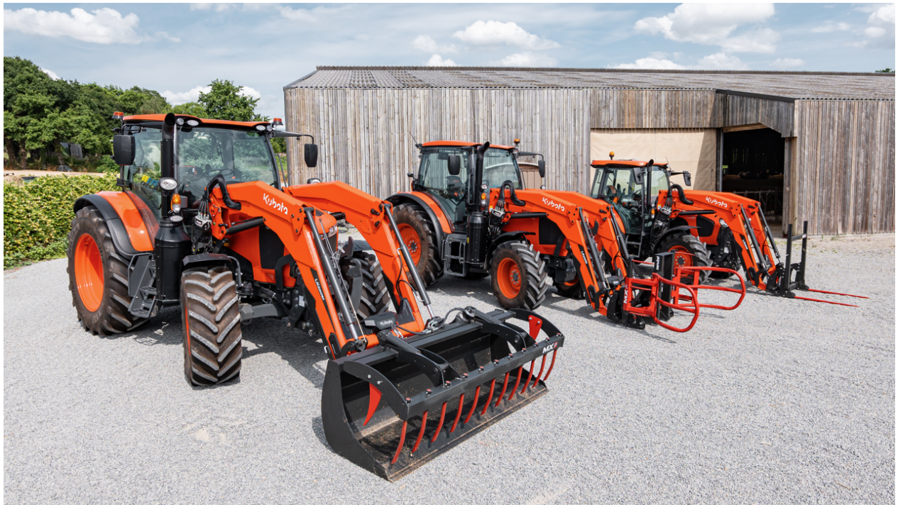
Afbeelding: de nieuwe LK-M serie voorladers gemonteerd op M6002, M6001 U en M5002 Serie.

Kubota lanceert met trots de nieuwste LK-M serie, een revolutionaire lijn voorladers ontworpen om de werkervaring in het veld naar nieuwe hoogten te brengen. Dit assortiment is het resultaat van uitgebreid onderzoek en een niet aflatende inzet voor innovatie en is ontworpen om te voldoen aan de uiteenlopende behoeften van boeren, niet alleen vandaag, maar ook tot ver in de toekomst.