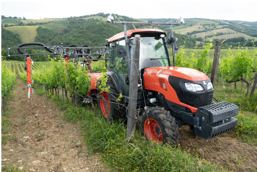
Immagine: Trattore Kubota equipaggiato con sensori Chouette per la scansione della presenza di malattie in vigneti di aziende agricole sperimentali in Italia.

Insieme, Kubota e Chouette si concentrano su strumenti pratici che sfruttano le sinergie tra le attrezzature avanzate e la tecnologia dell'Intelligenza Artificiale (AI), e supportano i viticoltori a superare le attuali sfide del settore, tra cui la carenza di manodopera e le questioni legate allo sviluppo dell'agricoltura sostenibile.