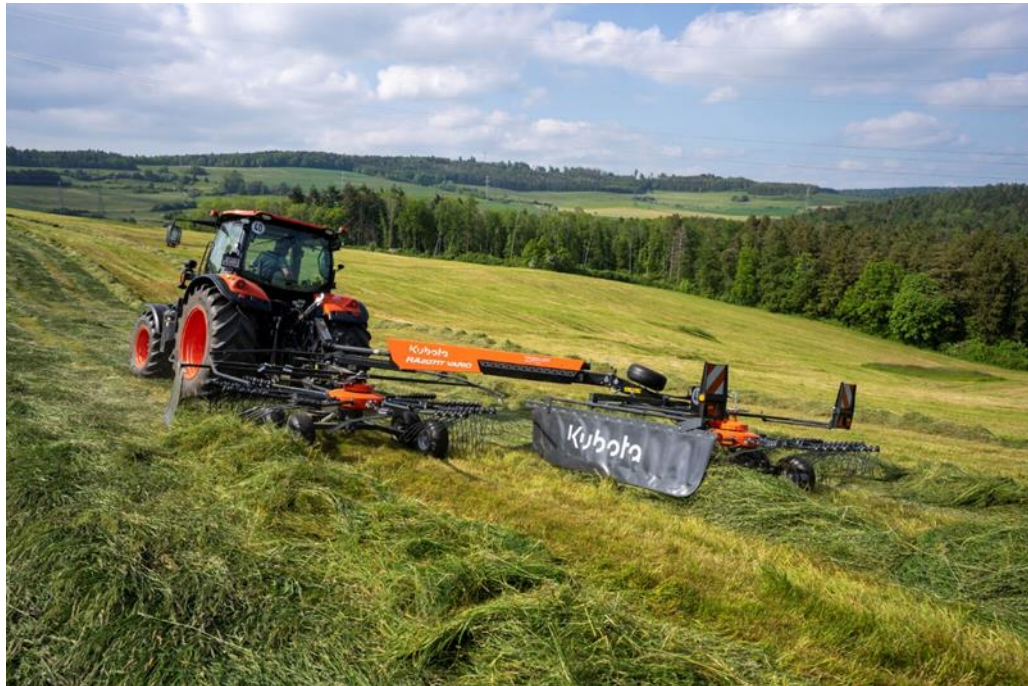
Afbeelding: Kubota RA 2071T Vario

De Kubota RA2071T Vario is ontworpen voor maximale flexibiliteit.