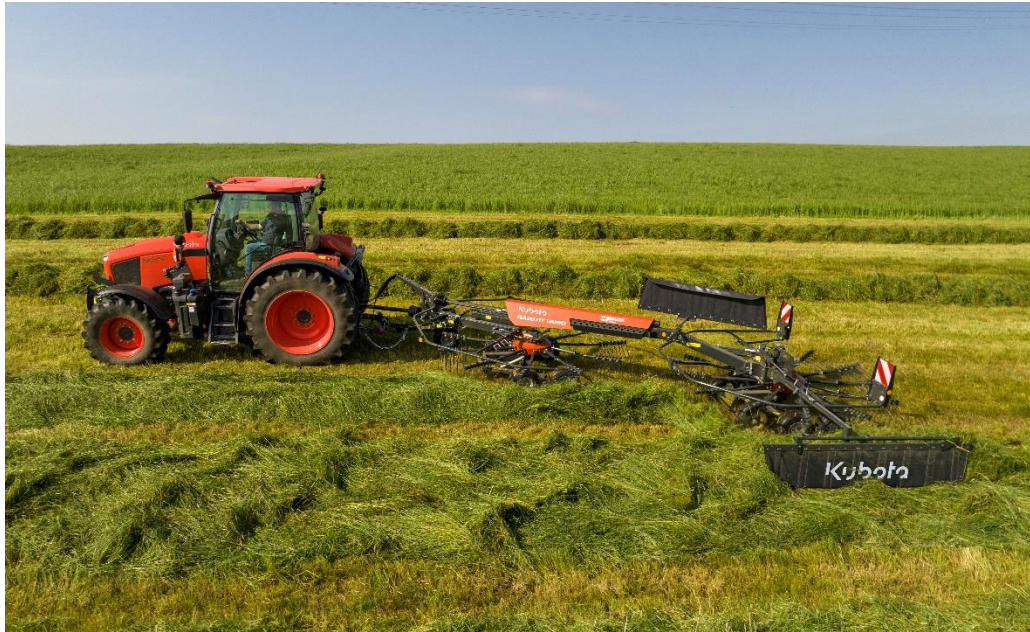
Tweede afbeelding: Zijwaartse verschuiving van de rotor

De RA2071 heeft ook een bewezen QuickLift-systeem waarmee de rotoren hydraulisch omhoog kunnen worden geheven uit het zwad. De maximale hoogte die kan worden bereikt is 50 cm. Een van de voordelen van de RA2071 is dat de werkhogte comfortabel van bovenaf kan worden ingesteld.