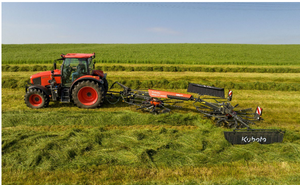
SideShift del rotore

Anche RA2071T Vario è dotato del collaudato sistema di sollevamento rapido che consente il sollevamento idraulico dell'andana. L'altezza massima raggiungibile è di 50 cm. Uno dei vantaggi di RA2071T Vario è che l'altezza di lavoro può essere regolata comodamente dalla cabina.