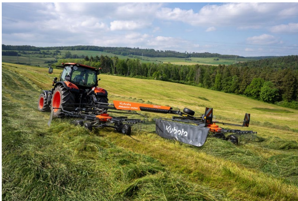
Kubota RA 2071T Vario

The Kubota RA2071T Vario è progettato per offrire la massima flessibilità