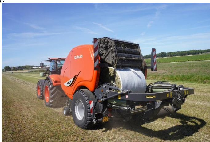
Zdjęcie: Opcja filia na filie

Inne ulepszenia, w tym ulepszenia strukturalne, bardziej precyzyjne owijanie i mniejsze zanieczyszczenie upraw, zwiększają stabilność i wydajność maszyny. Tymczasem kilka dodatkowych elementów, takich jak zmodernizowana rolkowa prasa zbierająca, przeprojektowany dyszel umożliwiający krótsze kąty skrętu i bardziej precyzyjny interfejs użytkownika wyświetlany na terminalu ISOBUS, to tylko niektóre z nowych funkcji, które sprawiają, że Kubota FB1000 Premium spełnia Twoje potrzeby!