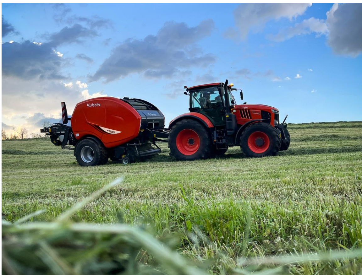
Foto: Kubota FB1000 Premium stelt nieuwe doelstelling in voor baalcapaciteit

Verbeterde Kubota FB1000 Premium perswikkelpakket